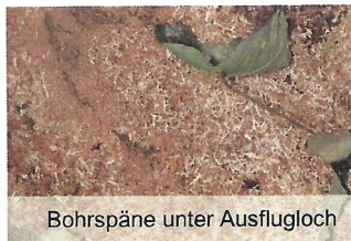
Bohrspäne unter Ausflugloch