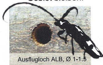
Ausflugloch ALB, Ø 1-1.5

Deponieren Sie anfallendes Grüngut in den dafür bezeichneten Containern in Ihrer Gemeinde. Nicht auf den Kompost oder in den Kehricht geben. Brennholz muss im Gebiet bleiben.